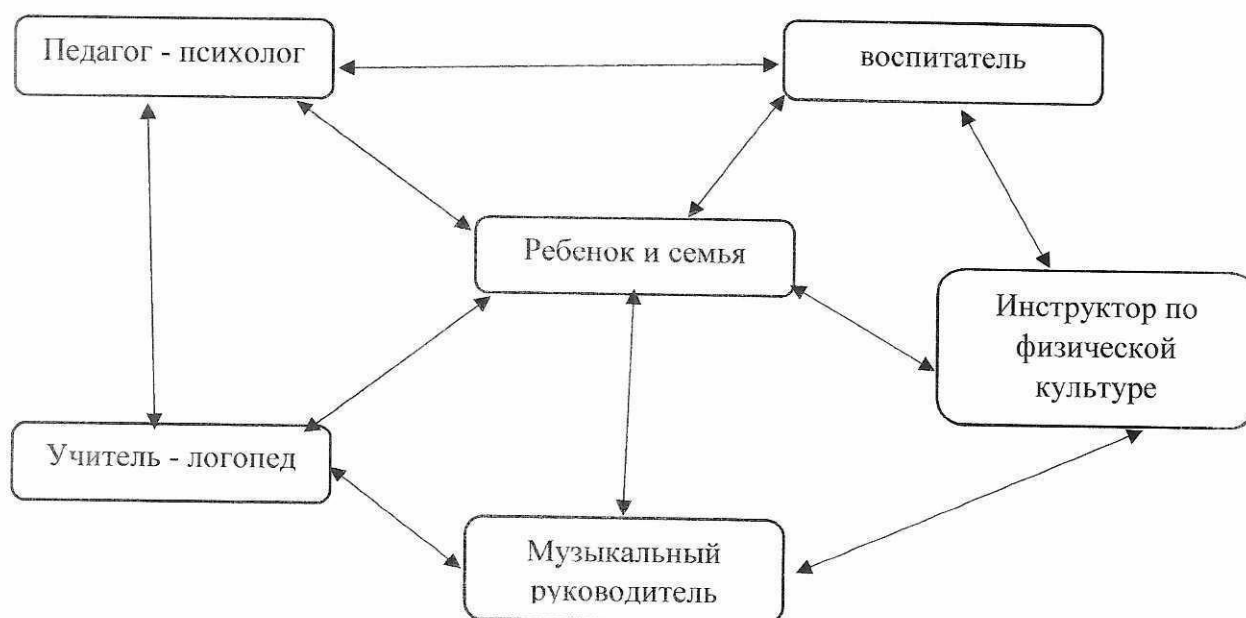
Модель взаимодействия педагогов

Специалисты намечают единый комплекс совместной педагогической работы по развитию детей: