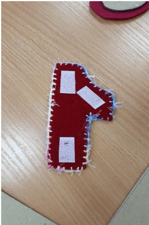
Внутренняя сторона цифр.